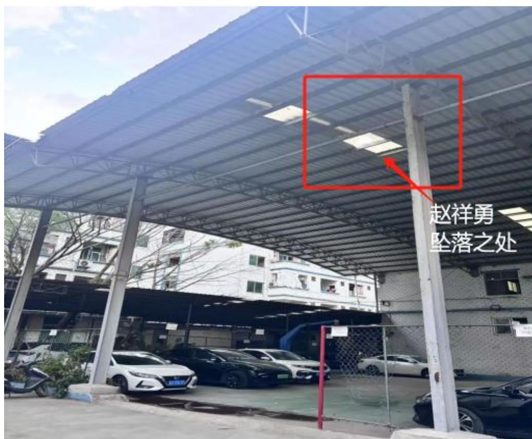
图 1 事故位置示意图

现场位于流沙东街道华溪村工业区石万片 7 号，为普宁市信诚科纺纺织有限公司（前身为普宁市联泰印染制衣有限公司）厂区内一停车场，占地面积约 200 平方米。普宁市信诚科纺纺织有限公司位于东二环大道东侧，324 国道北侧。现场停车场有遮阳顶棚，顶棚为彩钢瓦结构。顶棚有采光孔，采光孔覆盖透明采光板。从高处望向顶棚，顶棚上方部分铺设光伏板。